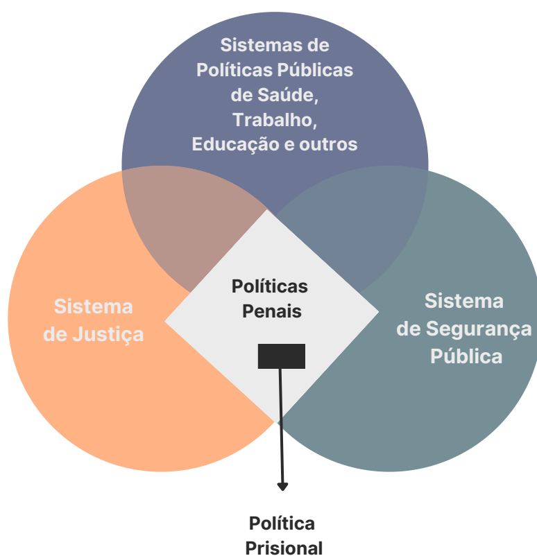
Figura 2: Interfaces da Política Penal com outros Sistemas