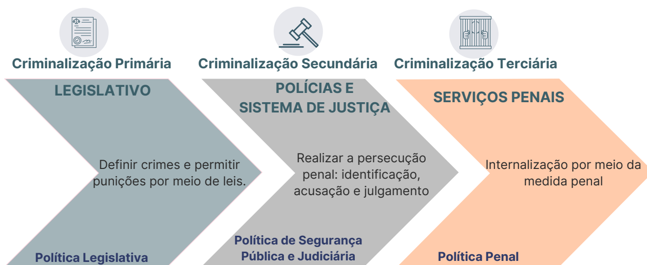
Figura 1: Sistema Penal por tipo de Criminalização, Instituição e Política